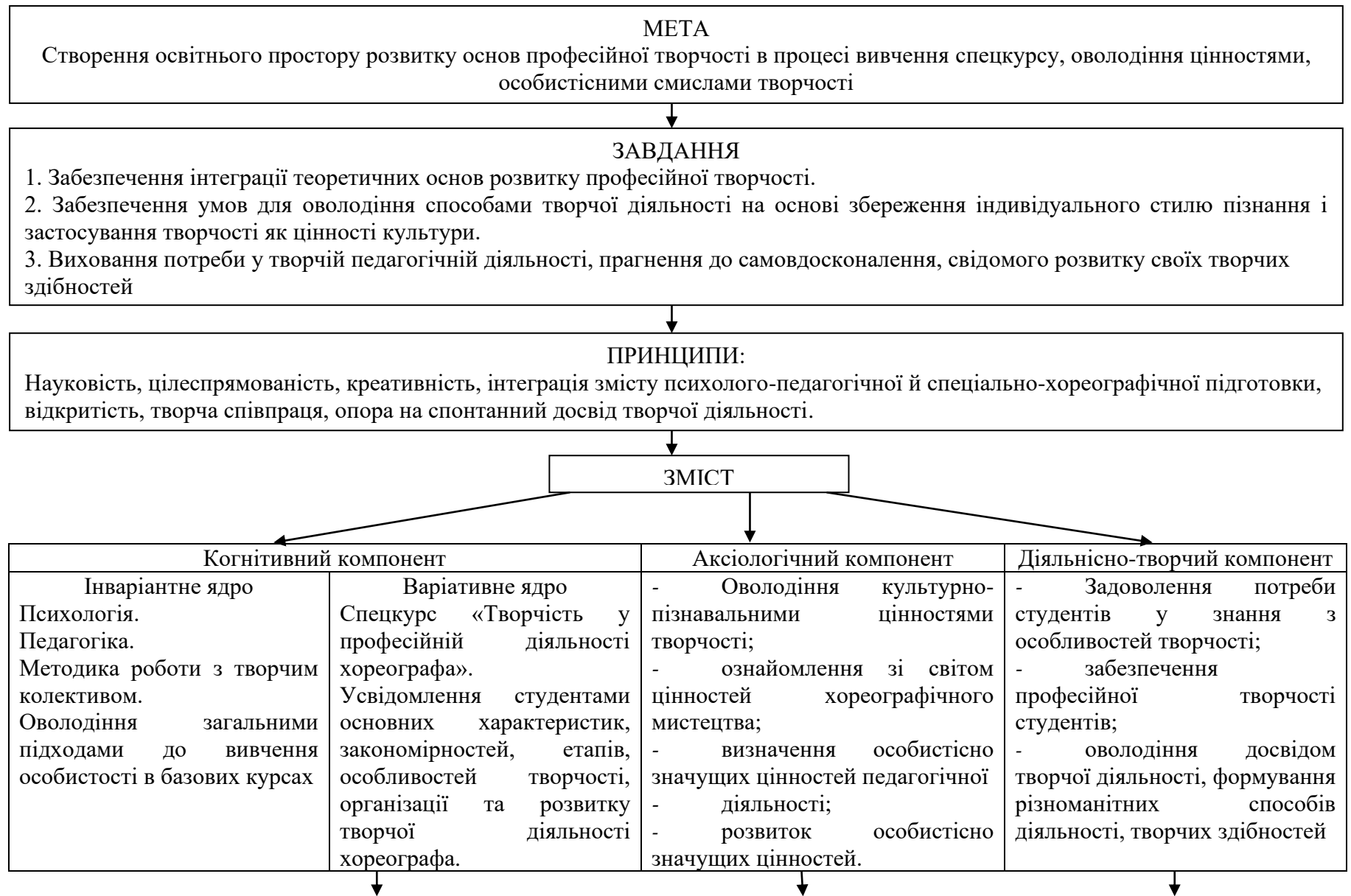
Рис. 2.1. Модель процесу розвитку основ професійної творчості майбутніх хореографів