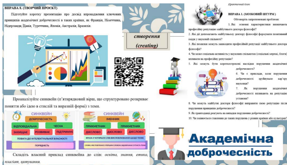
Рис.6. Пропоновані вправи з академічної доброчесності на етапі створення

Таким чином, концепція Блума передбачає, що навчальні цілі залежать від ієрархії когнітивних процесів, де кожен рівень вимагає спеціальних вправ, які сприяють розвитку відповідних навичок.