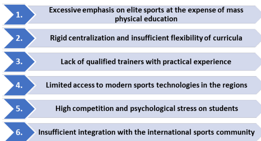
Fig.1. Problems of training future specialists in physical culture and sports in China

1. Excessive emphasis on elite sports at the expense of mass physical education. The Chinese sports training system is traditionally focused on educating champions, which leads to a focus of resources on a limited circle of gifted athletes. At the same time, the development of mass sports, physical culture, and health work with the population remains a poor priority. This limits the training of specialists who can work effectively with professional athletes, schoolchildren, students, and the elderly.