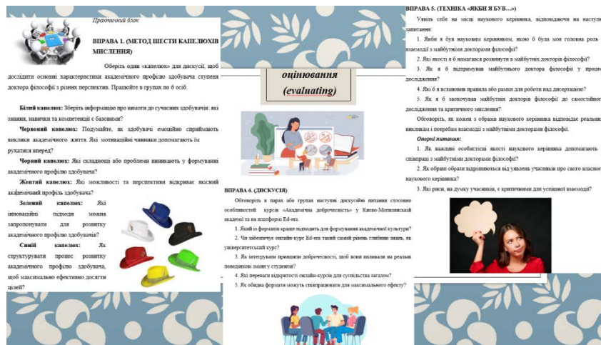
Рис.5. Низка вправ з академічної доброчесності на етапі оцінювання

- Етап створення (creating) характеризується поєднанням ідей з метою створення нових підходів, що може бути досягнуто за допомогою таких вправ: