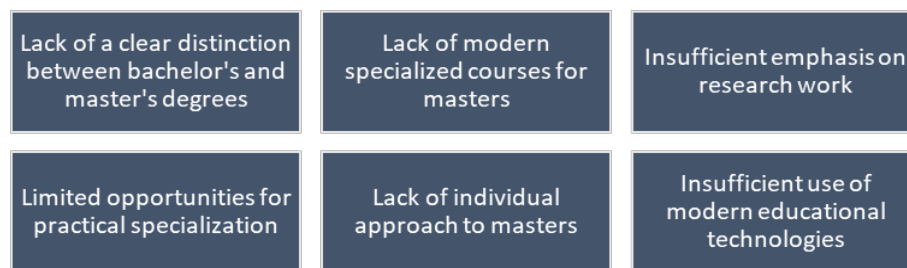
Fig.1. Systemic shortcomings in the training of masters of physical education in Ukraine

Professional training for masters of physical education in Ukraine has several specific problems that distinguish it from the training of bachelor and affect the quality of graduates. If the bachelor's program is focused on forming general professional competence, then the master's level should provide deep specialization, research skills, and managerial qualities. However, these goals are often not achieved in practice due to systemic shortcomings (Fig. 1).