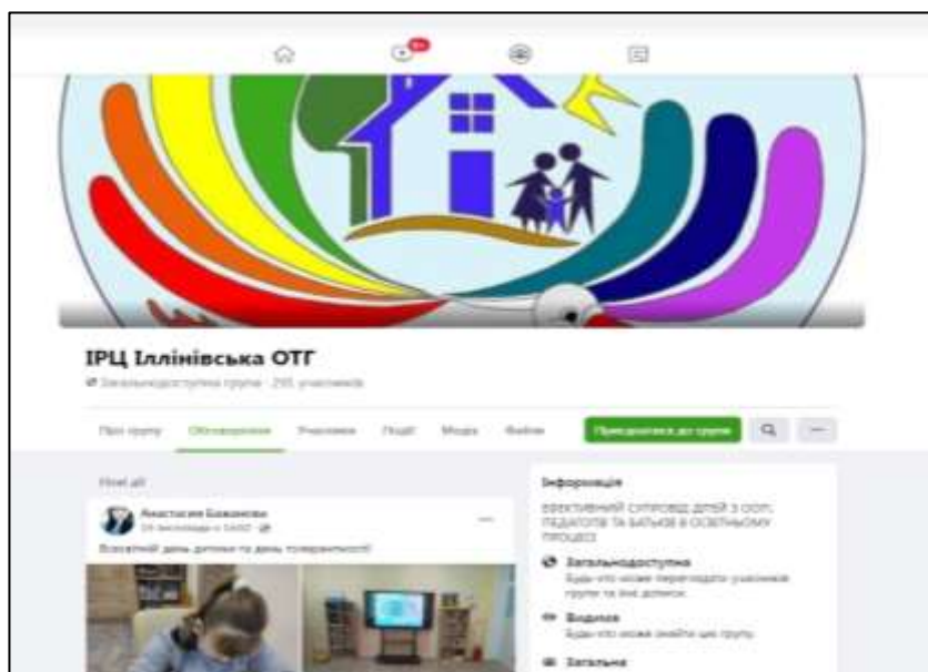
Рис. 2.3. Скріншот групи на фейсбуці ІРЦ Іллінівської сільської ради Костянтинівського району Донецької області