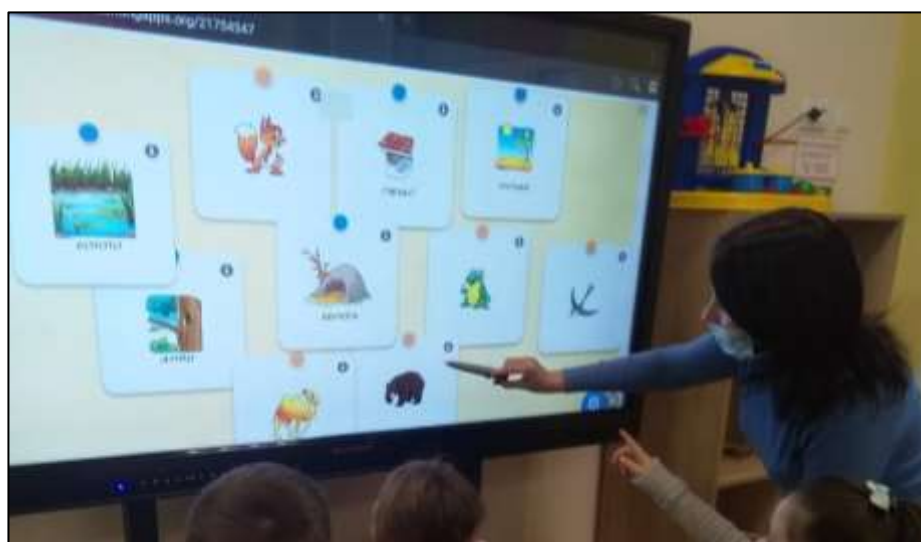
Рис. 2.2. Заняття в ІРЦ Іллінівської сільської ради Костянтинівського району Донецької області

Працює ІРЦ з квітня 2019 р., за цей час фахівці центру надали допомогу 30 дітям (Іллінівська громада налічує 25 сел та селищ, у ній проживає 9210 осіб, має 8 закладів середньої освіти, 3 заклади дошкільної освіти), що мають особливі освітні потреби. Інклюзивно-ресурсний центр має сайт та відкриту групу на фейсбуці, які містять актуальну інформацію для батьків, педагогів освітніх установ, що навчають дітей з особливими потребами у регіоні.