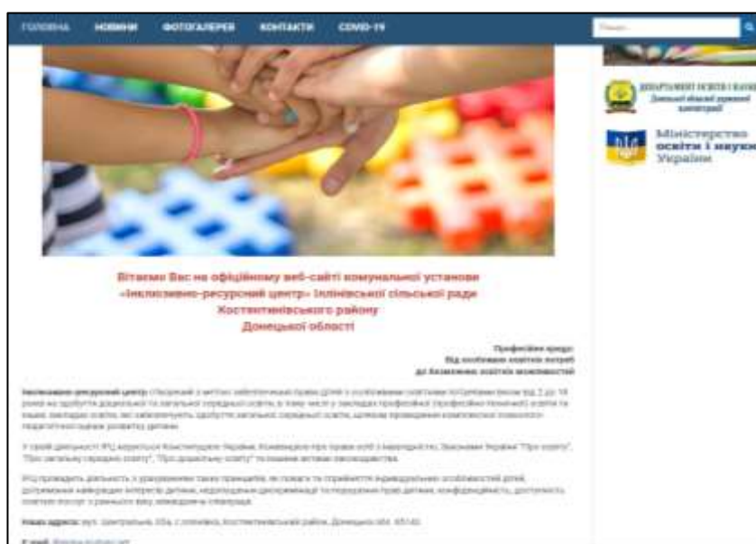
Рис. 2.4. Скріншот з офіційного сайту ІРЦ Іллінівської сільської ради Костянтинівського району Донецької області

Формами роботи фахівців центру з батьками є: індивідуальні та групові заняття (як із дітьми так і лише з батьками); просвітницька робота у вигляді консультацій та лекцій, яку присвячено особливостям психічного розвитку дитини, основам і принципам методів навчання і виховання; тренінги для