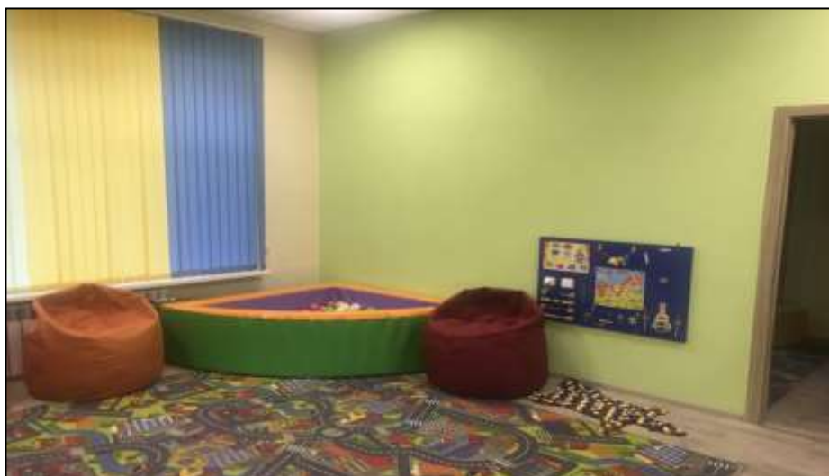
Рис. 2.1. Приміщення ІРЦ Іллінівської сільської ради Костянтинівського району Донецької області