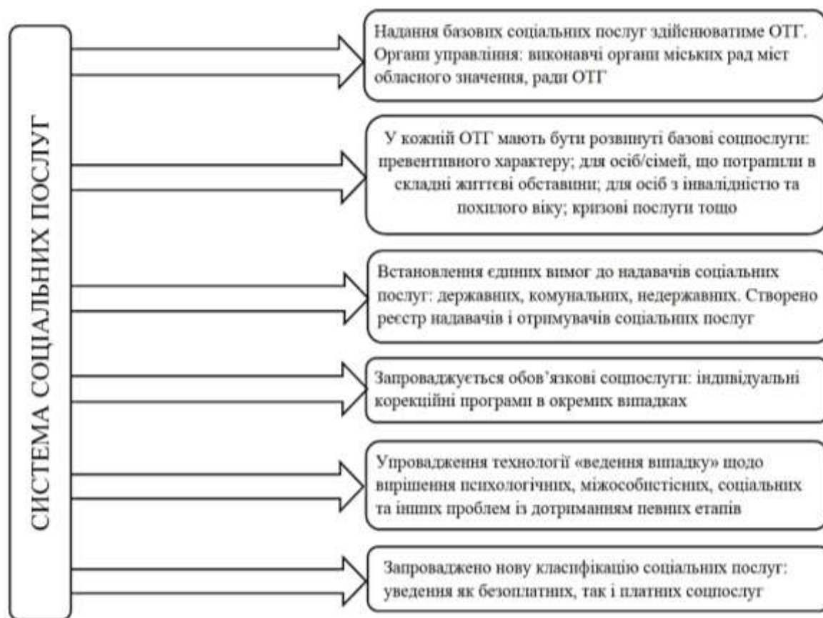
Рис. 1.2. Новації Закону України про соціальні послуги

Разом з тим, поряд з позитивними зрушеннями у соціальному законодавстві, констатуємо, що наразі відсутній універсальний нормативно-правовий акт з чітко прописаними підставами, переліком суб'єктів, видів, механізмів надання соціальних пільг. Тому трапляються ситуації, коли процедура надання соціальної допомоги представлено в різних нормативних актах, що іноді суперечать одне одному. В таких обставинах буває, що пільгами користуються не ті категорії населення, які цього потребують. Однією з причин такої ситуації є практична відсутність моніторингу доходу сімей та осіб, який би дозволяв вчасно коригувати необхідність соціальної допомоги.