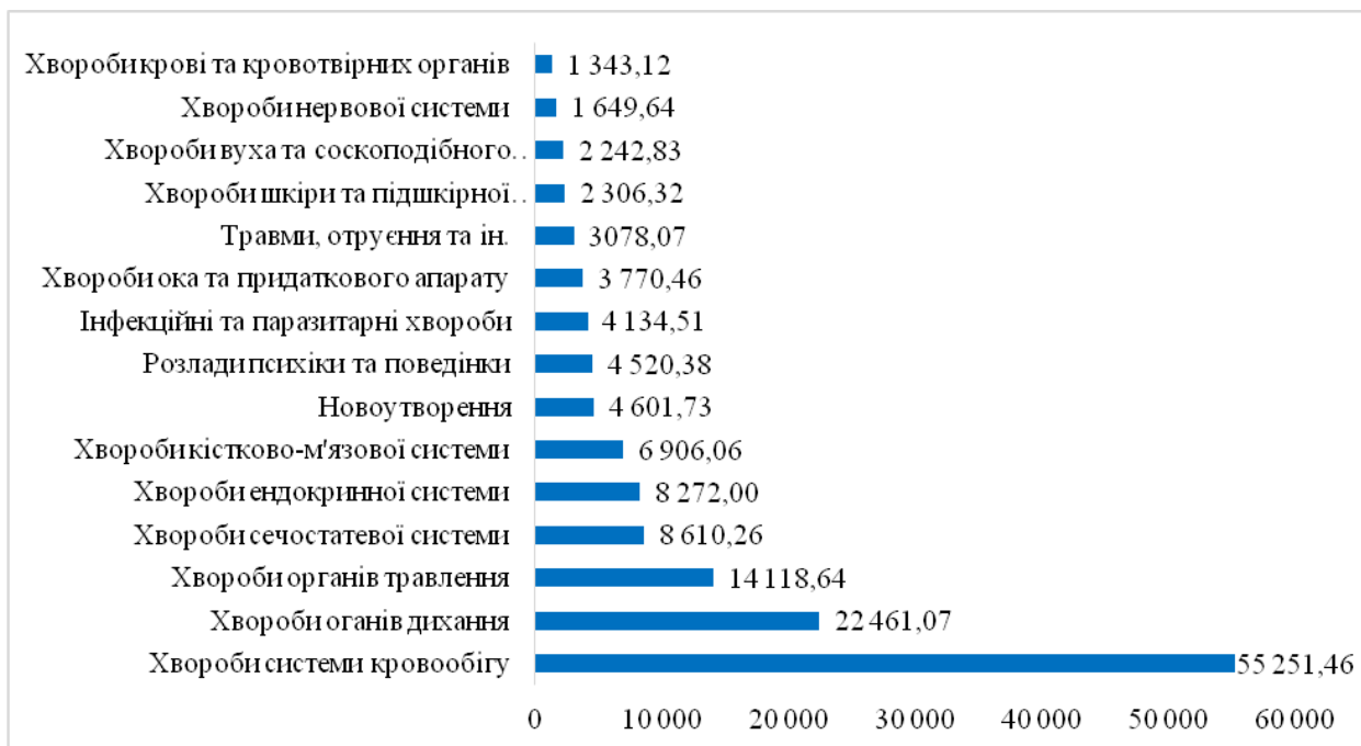
Рис. 2. Структура хвороб населення у Шосткинському районі Сумської області