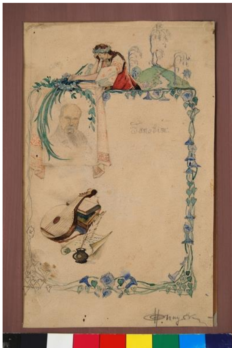
Мал. 4. Н.Онацький. Ескіз до обкладинки Кобзаря. Акварель, 1925. СОХМ імені Н.Онацького