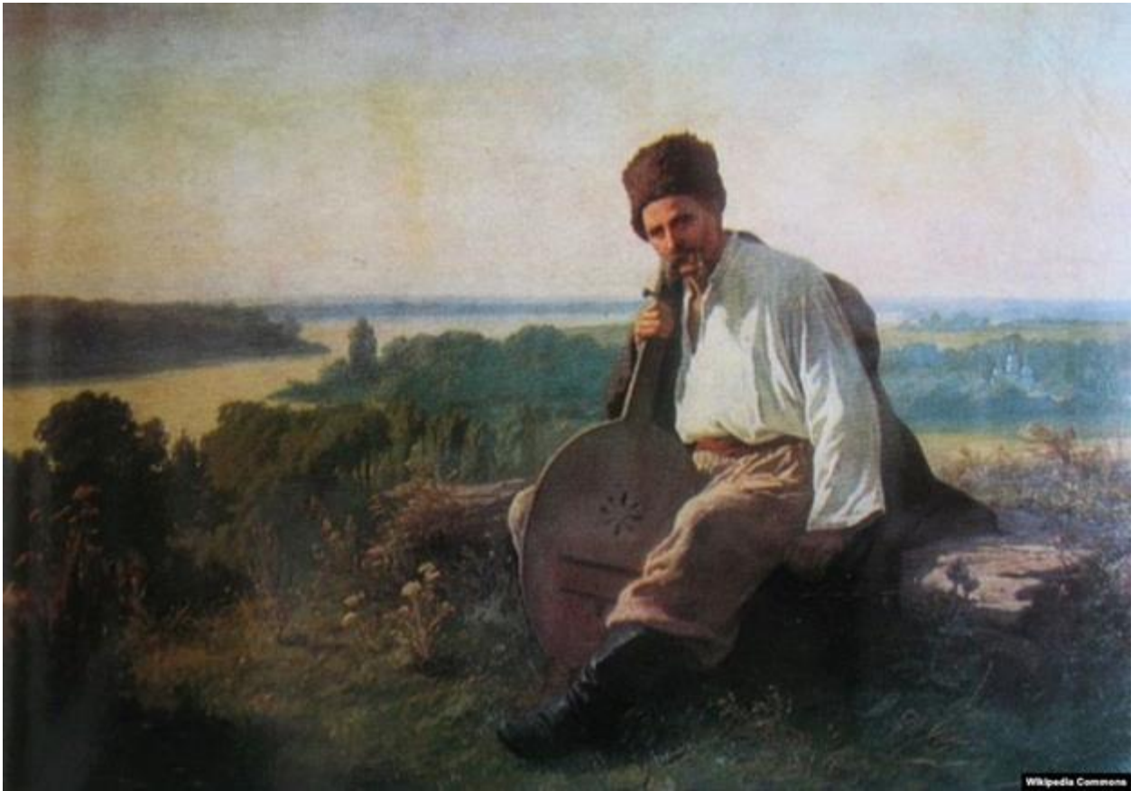
Мал. 2. К. Трутовський. Тарас Шевченко з кобзою над Дніпром. Полотно, олія, 1875.