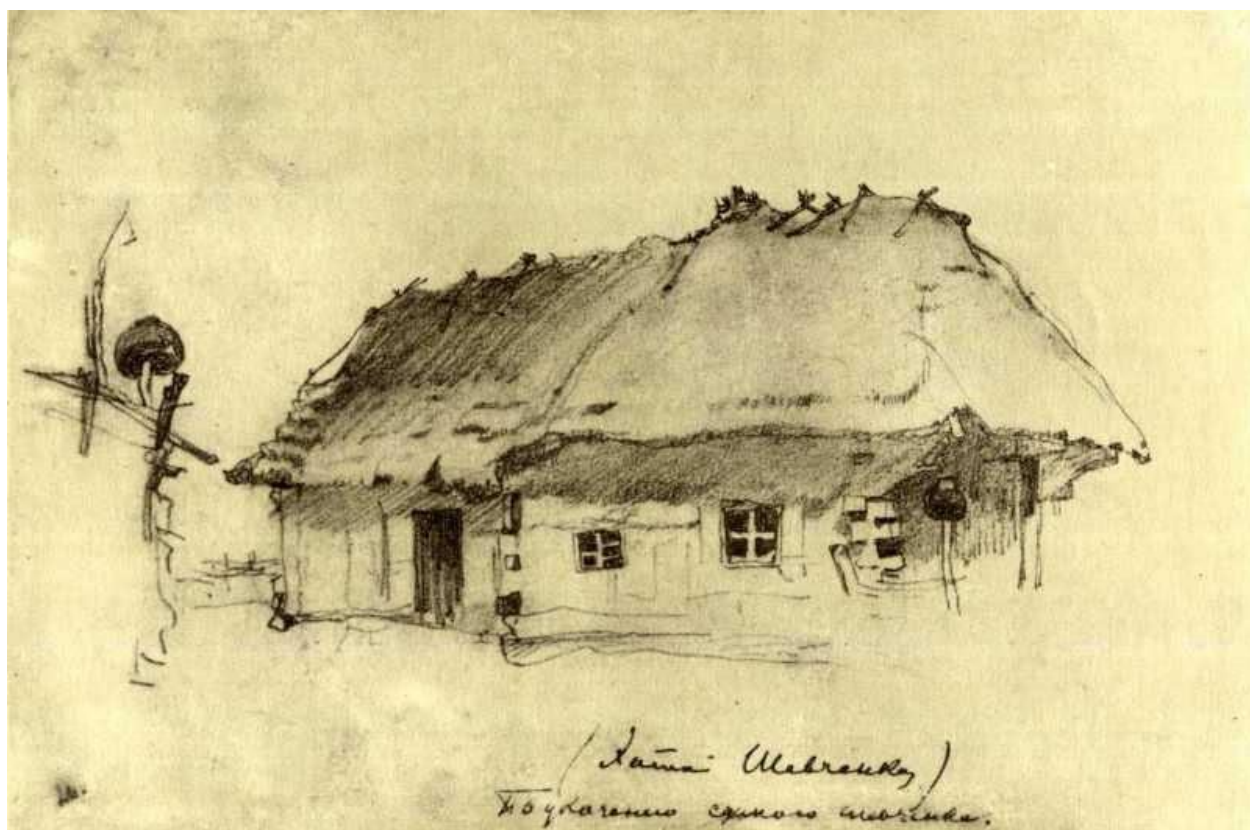
Мал. 5. Листівка. Шевченкова хата. За малюнком Н.Онацького. 1927. СОХМ імені Н.Онацького