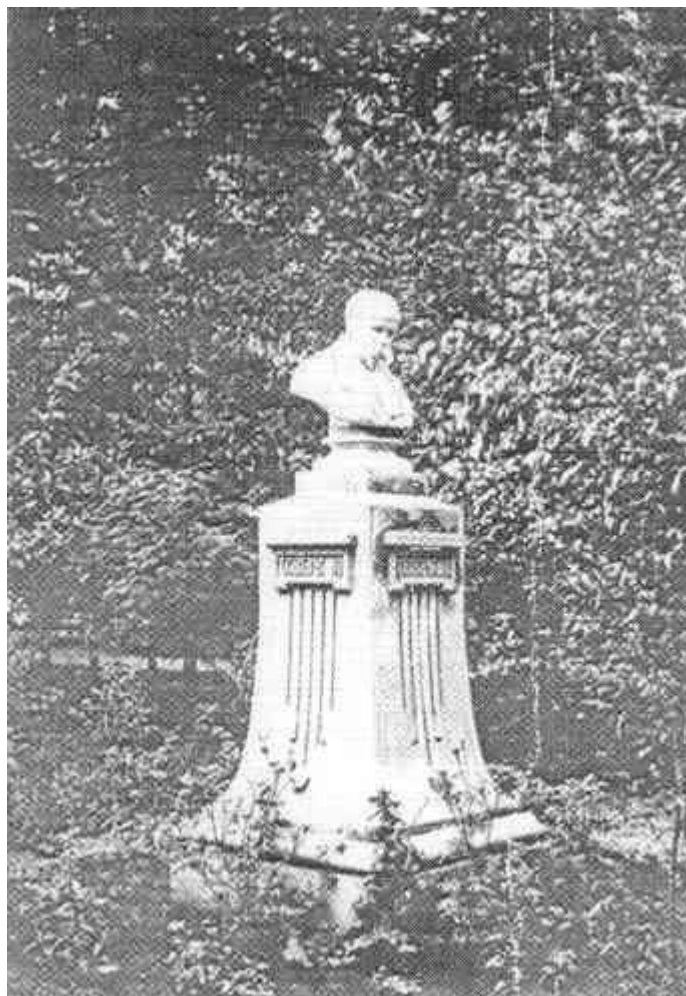
Мал. 3. В.Беклемішев. Перший пам'ятник Т.Шевченку на Слобожанщині, збудований на кошти родини Алчевських. Білий мармур. Харків, 1898. Нині знаходиться в Києві в музеї Кобзаря.